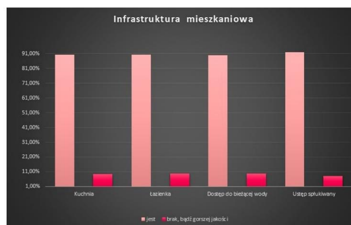
wykres przedstawiający poziom rozwoju infrastruktury mieszkaniowej sporządzony na podstawie ok. 1200 domostw

Święty Hieronim nauczał, że „ten, kogo chrzest oczyścił, nie musi się kąpać raz drugi”. Nakłaniał on także kobiety, aby w trosce o swoje dusze rozmyślnie się zaniedbywały. Za jego radą poszło wiele europejskich arystokratek oraz władców, lecz król Gustaw jako dobry monarcha dba o higienę swoich poddanych.